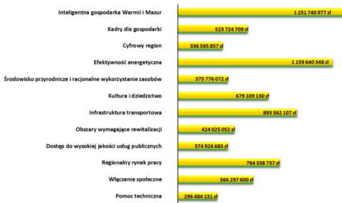
Alokacja osi priorytetowych