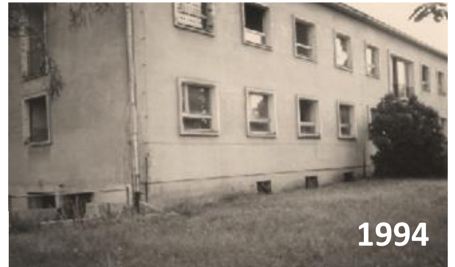
ul. Bydgoska 7; Olsztyn