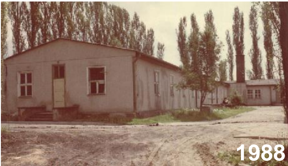
ul. Tuwima 10; Olsztyn