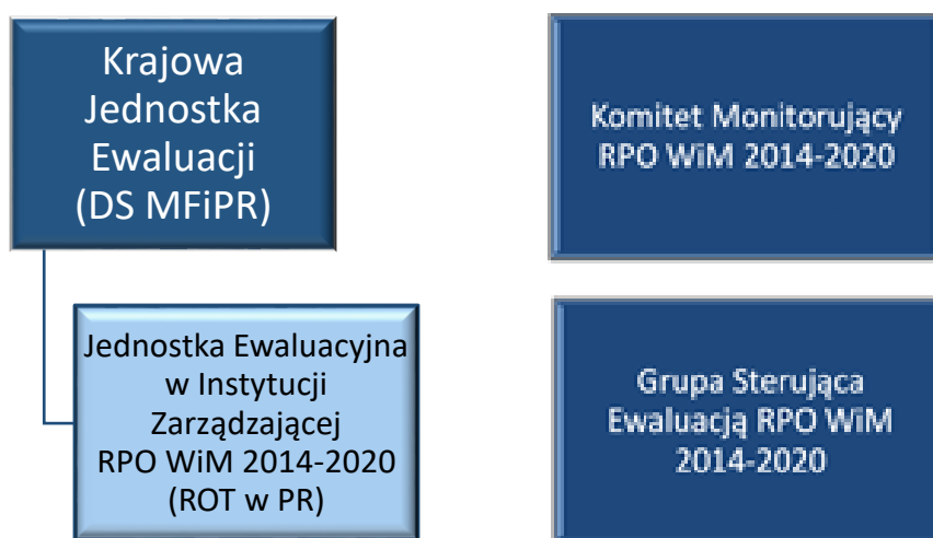
Schemat 1. Podmioty zaangażowane w proces ewaluacji RPO WiM 2014-2020

Za koordynację procesu ewaluacji RPO WiM 2014-2020 odpowiedzialna jest IZ RPO WiM 2014-2020, a w jej ramach utworzona w tym celu Jednostka Ewaluacyjna RPO WiM 2014-2020 (JE RPO WiM 2014-2020) umiejscowiona w Regionalnym Obserwatorium Terytorialnym w Departamencie Polityki Regionalnej Urzędu Marszałkowskiego Województwa Warmińsko-Mazurskiego w Olsztynie.